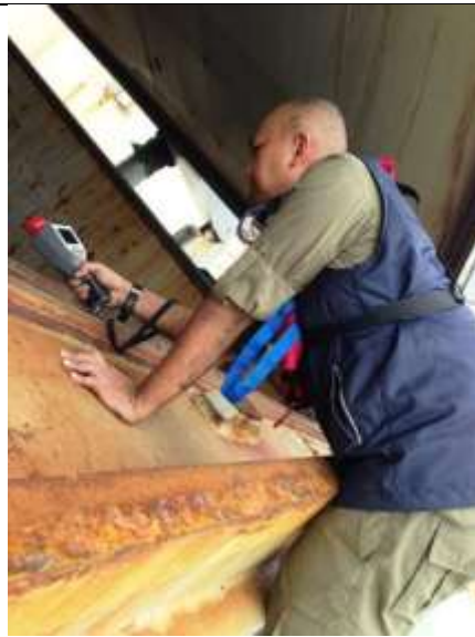
Pengukuran di permukaan palka penyimpanan Pasir Besi