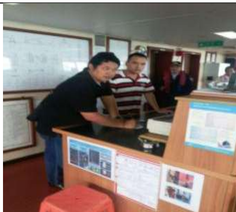
Nahkoda Kapal MV Ocean Carrier dan Agen Pelayaran