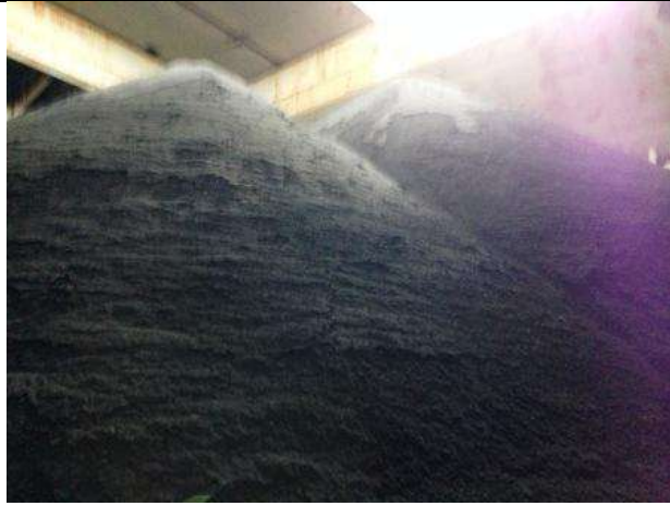
Palka 4 (didalam bunker Penyimpanan pasir Besi kedalaman ±18 meter)