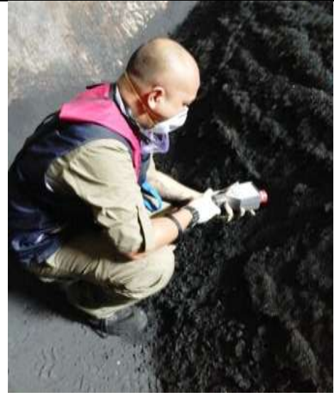
Pengukuran laju paparan radiasi dan identifikasi nuklida di dalam palka 4