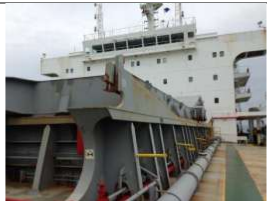
Palka 5 (bunker Pasir Besi) tempat dimulainya pengukuran paparan radiasi