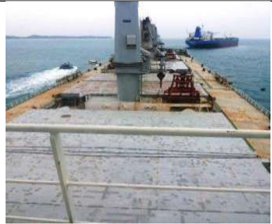
Palka tempat penyimpanan Pasir Besi