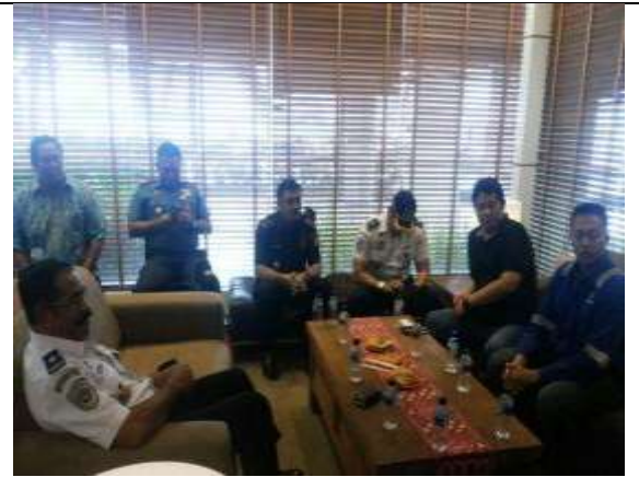
Pertemuan sebelum dilaksanakan pemeriksaan kapal MV Ocean Carrier (Bakamla, POLDA Kepri, KPLP, BAPETEN, BEA & CUKAI, KKP KEMENKES, BIN, TNI AL)