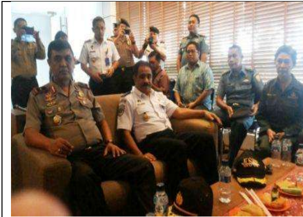
Foto-Foto Hasil Pemeriksaan Kapal MV Ocean Carrier