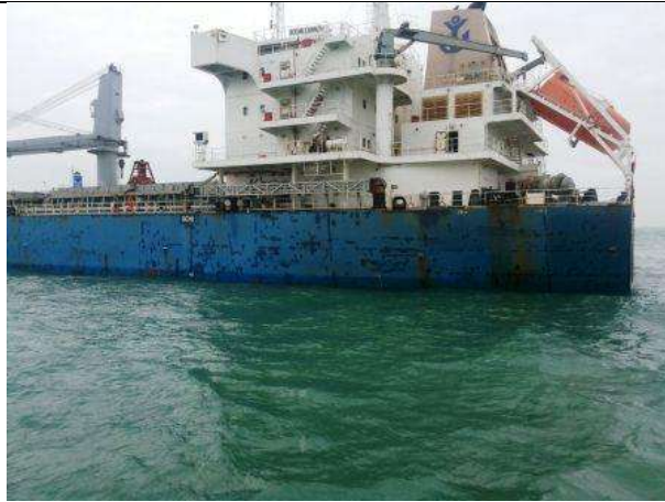
Kapal MV Ocean Carrier